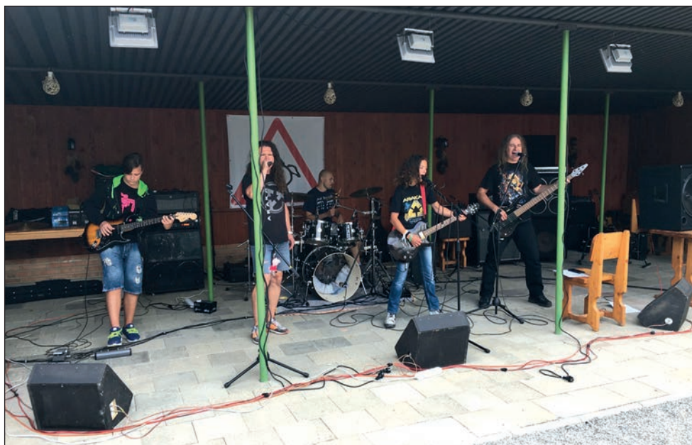
Rockova omladina na EDENU