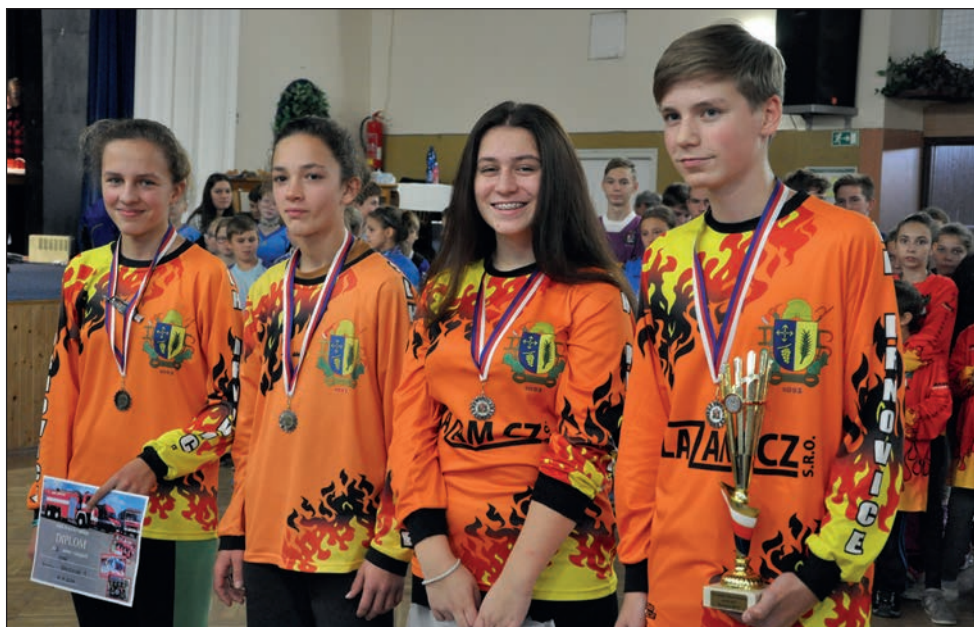
Starší žáci na soutěži v uzlování