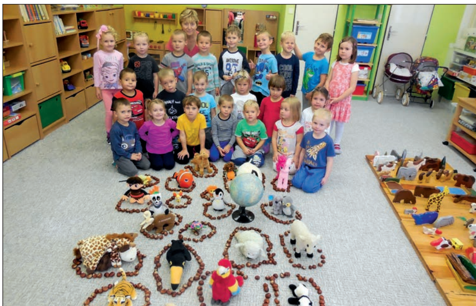
Sovičky slaví Den zvířat