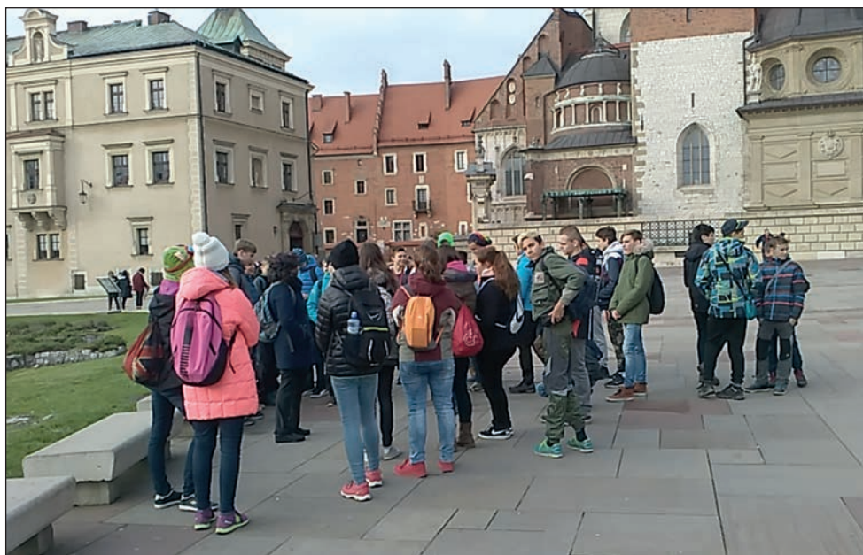
Žáci školy na nádvoří krakovského Wawelu