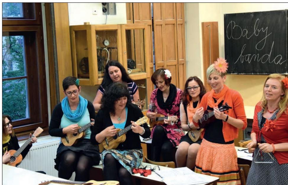
Noc literatury KKD