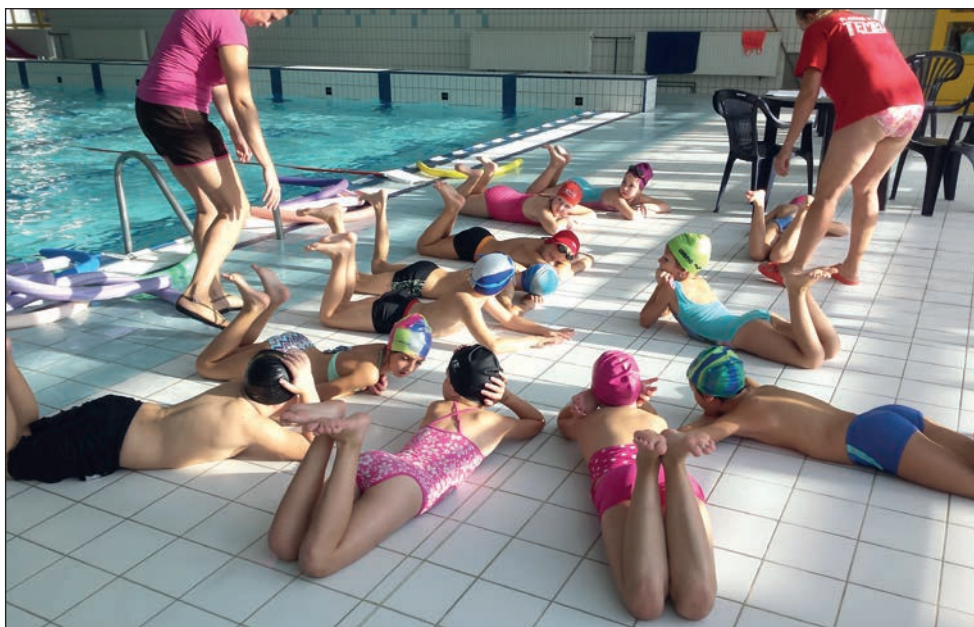
Plavecký výcvik na suchu