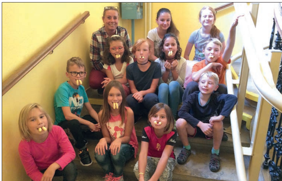
Tvůrčí dílničky pro děti