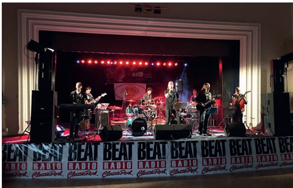
Soft Rock Cacao na festivalu Drnovický Asfalt