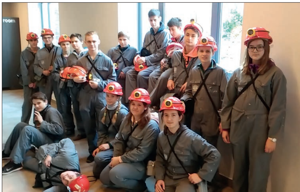
Návštěva solného dolu Wieliczka v Polsku