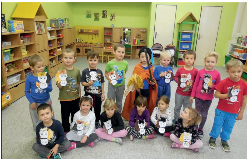
Do MŠ přijel sv. Martin, ale sníh nedovezl