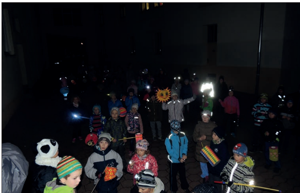
Průvod světlušek Drnovicemi