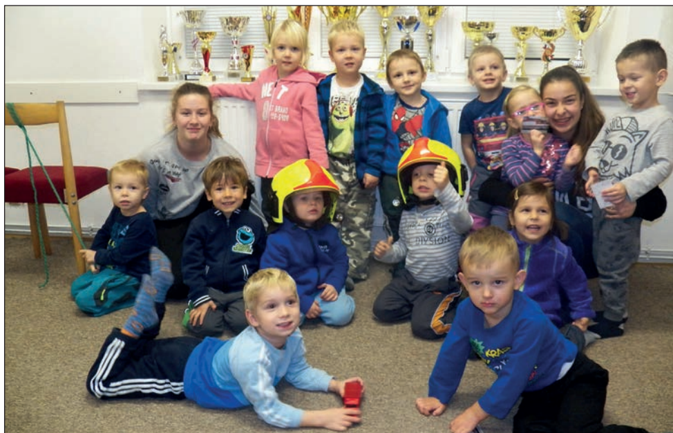
Nově vzniklé družstvo přípravy