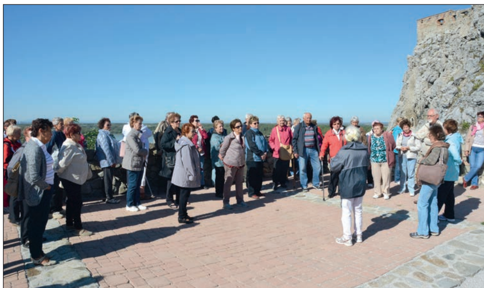
Drnovičtí senioři na Děvíně