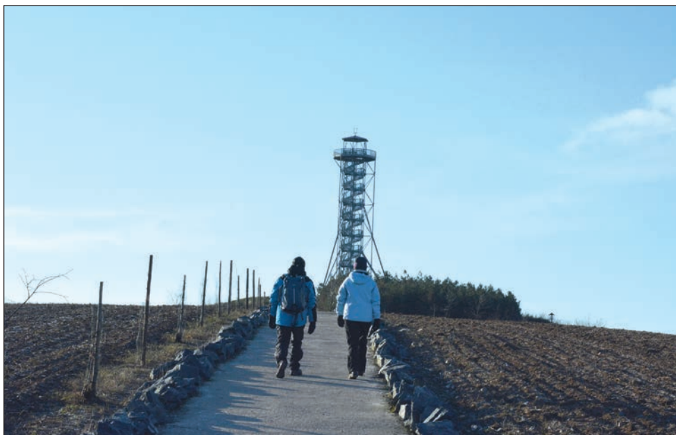
Denně navštíví rozhlednu na Chocholíku desítky turistů