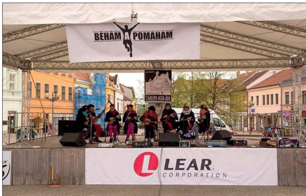
Benefiční běh