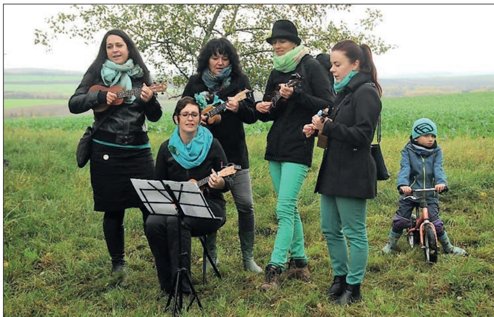
Masarykův pochod Drnka