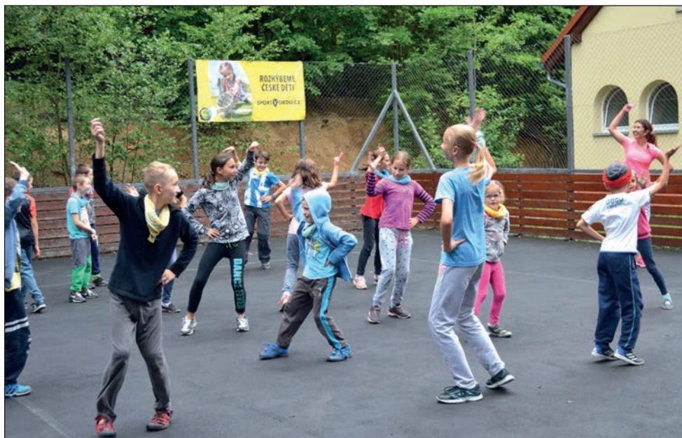
Tábor 2017 - rozhybeme české děti