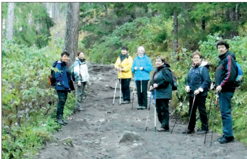
Oddíl žen - výlet do Vysokých Tater