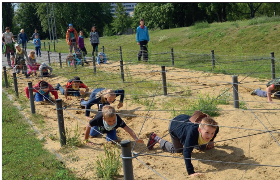
Táborníci v kasárnách