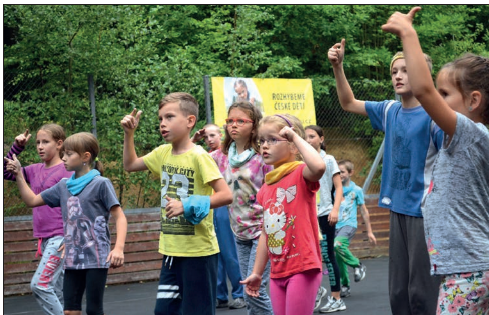
Tábor a zumba - počítání