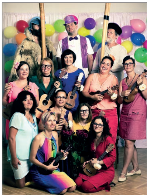
Křest CD Barvy duhy