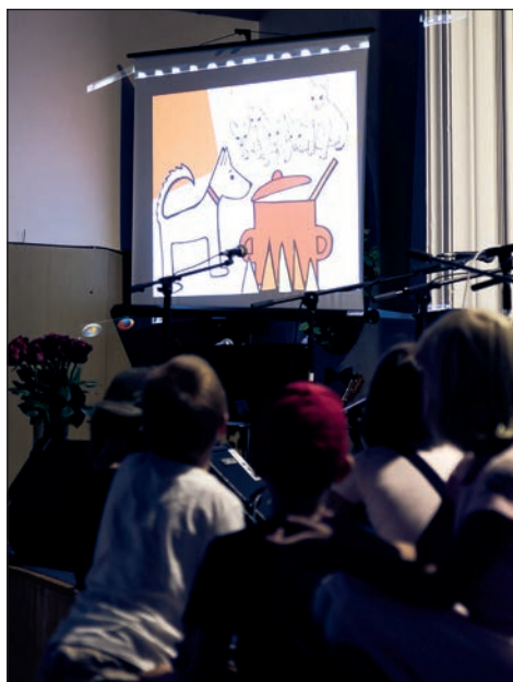
Videoklip pro děti Pes Jack